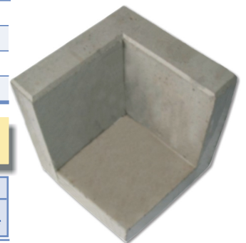
Eckstein (einteilige Aussenecke)